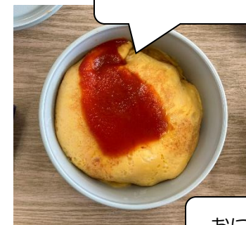
上にかけてある卵